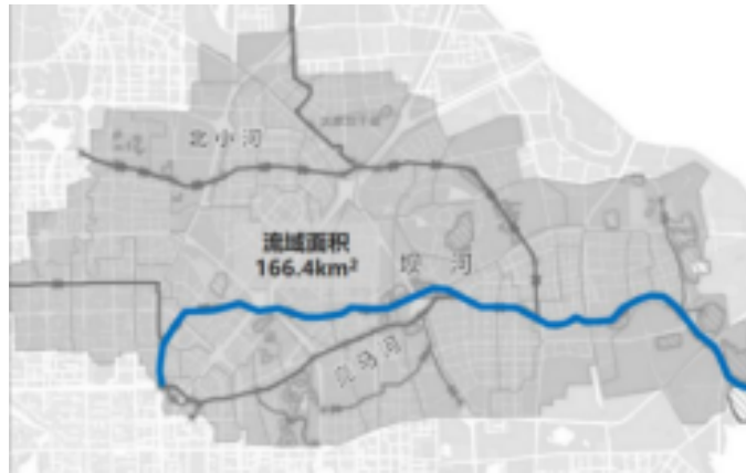
图4-2. 坝河流域面积图